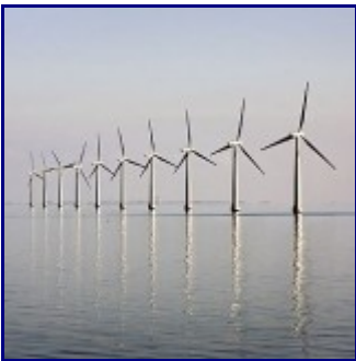
Windkraftwerk in Dänemark

Unterschiedliche Dimensionen beim Ausbau der Windenergie-Felder in Dänemark und der Schweiz