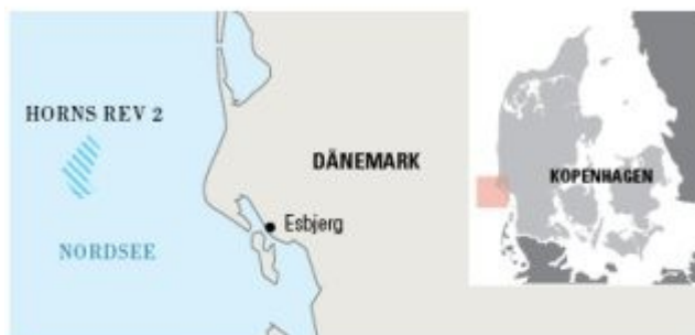
Standort der Windturbinen